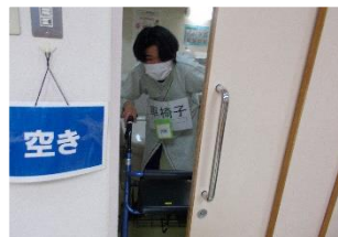
なりきって待機中